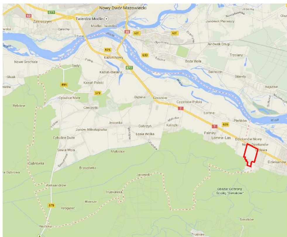
Ryc. 1 Położenie terenu opracowania na tle gminy

Pod względem środowiskowym obszar leży w pasie pomiędzy Kampinoskim Parkiem Narodowym, graniczącym bezpośrednio z południową częścią opracowania, a doliną Wisły, znajdującą się ok. 2 km na północ od terenu. Kampinoski Park Narodowy, jak i dolina Wisły są jednymi z najważniejszych elementów systemu przyrodniczego w województwie mazowieckim, zarówno pod względem środowiskowym, jak i krajobrazowym.